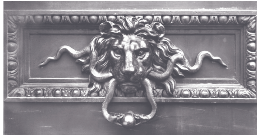
Heurtoirs du Portail d'Honneur

Exécutés d'après les dessins de Jacques-Denis Antoine, les décors en bronze du portail furent réalisés par le jeune frère de l'architecte, le sculpteur ornemaniste de beau talent Jean-Denis Antoine (1735-1802) ; une riche paire de grilles de bronze, dont les médaillons centraux s'ornent de lauriers et du chiffre royal, deux "L" enlacés ainsi que deux marteaux d'airain formés d'un mufler de lion mordant des serpents ; que l'on préféra finalement aux têtes de Méduse pour lesquelles on conserve également un projet dessiné.