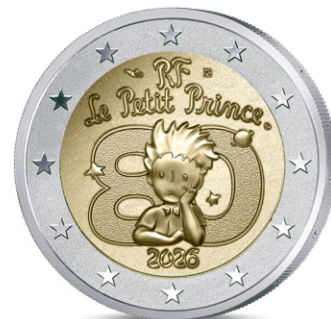
Qualité BE (Belle Epreuve) polissage inversé Ø 25,75 mm – 8,5 g 5 000 exemplaire — 32€

Les numismates exigeants se tourneront quant à eux vers les versions BE (Belle Epreuve), la plus haute qualité de frappe. La gravure y est magnifiée par un jeu de textures entre les reliefs sablés et un fond poli miroir. Ces monnaies bénéficient d'une attention toute particulière et un outillage de frappe spécifique pour ne présenter aucun défaut et sont frappées en quantités très limitées. Elles sont présentées en coffret individuel avec certificat numéroté.