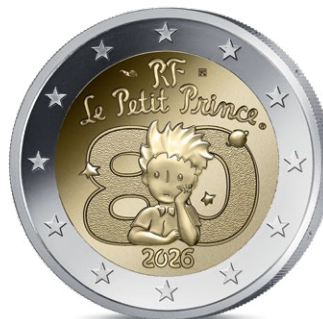
Qualité BE (Belle Epreuve) Ø 25,75 mm – 8,5 g 15 000 exemplaire — 26€