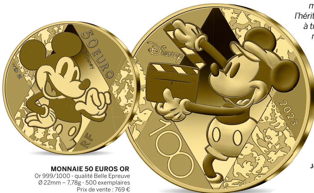
MONNAIE 50 EUROS OR Or 999/1000 - qualité Belle Epreuve Ø 22mm - 7,78g - 500 exemplaires Prix de vente : 769 €

“ Cette nouvelle collection célèbre la magie intemporelle de l'héritage de Walt Disney à travers des pièces de monnaie d'exception, où les personnages historiques des studios Disney rencontrent les savoir-faire millénaires de la Monnaie de Paris pour offrir une expérience inoubliable aux collectionneurs et fans de la licence.”