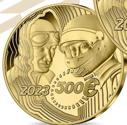
MONNAIE 500 EUROS OR Or 999 % - Qualité Belle Epreuve Ø 50 mm – 155.5 g 24 exemplaires Prix de vente : 14 800 €

Au revers, on retrouve deux portraits de pilotes se faisant face. Le visage de gauche met en perspective un pilote du début du XX e siècle, participant à la première édition du grand prix d'endurance de l'Automobile Club de l'Ouest tandis que le visage de droite marque l'évolution d'un siècle de compétition automobile. Le tracé du circuit des 24 Heures du Mans se traduit comme un miroir, une fenêtre s'ouvrant sur le passé mais également sur l'avenir.