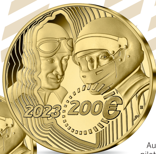
MONNAIE 200 EUROS OR Or 999 % - Qualité Belle Epreuve Ø 37 mm – 31.104 g 250 exemplaires Prix de vente : 2 965 €