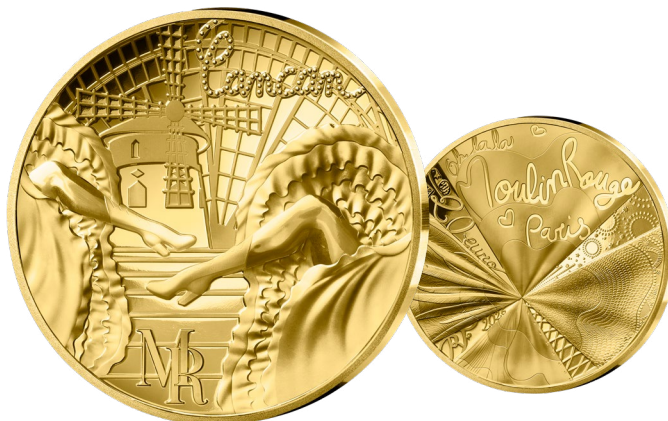
MONNAIE 200 EUROS OR QUALITÉ BE (BELLE EPREUVE) Or 999‰ – 38x36,73 mm – 31,104g 250 exemplaires — 5 900€*