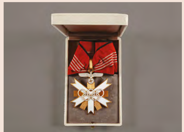
Coffret Deutsches Olympiaehrenzeichen 1936 Collections Musée national du Sport, France.

Un autre changement important survient à la faveur des Jeux de Munich (1972). Désormais toute liberté est laissée à chaque comité organisateur de disposer pleinement du revers de la médaille. Ce sera là le début d'une longue mutation de la récompense la plus convoitée au monde.