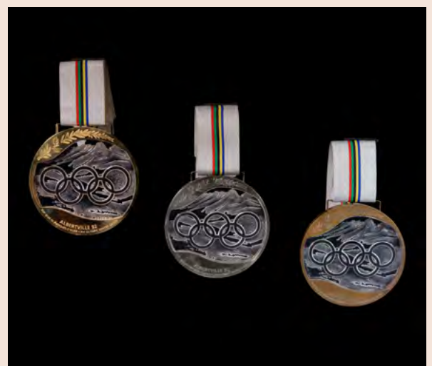
Médailles or, argent et bronze des Jeux d'Albertville 1992 Maison Lalique, Collection Lalique SA.