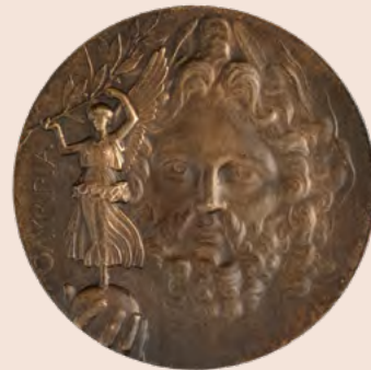
Médaille des Jeux de la Première Olympiade (Athènes, 1896) Jules-Clément Chaplain (1839 – 1909), Bronze (médaille), Monnaie de Paris

* Le mot «olympiade» n'est pas synonyme d'édition des Jeux Olympiques, mais recouvre la période de quatre années séparant deux éditions des Jeux.