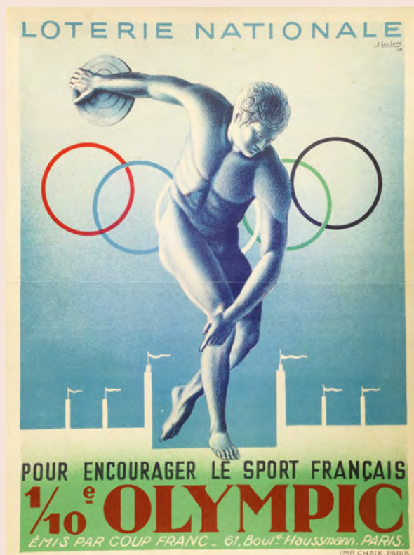
Affiche Pour encourager le sport français – 1/10 e Olympic, 1940 Papier imprimé – J. Leclerc (dessin), Loterie Nationale (éditeur)

Au-delà de ce statut touchant à la personne, certaines disciplines ont, par leur gestuelle, leur symbolique et leur esthétique, profondément marqué l'histoire de l'Olympisme. Ainsi, et presque à elle seule, la figure du discobole incarne l'idée que chacun se fait d'une Grèce olympique ayant servi de modèle aux Jeux de l'ère moderne : perfection de l'effort, dépassement de soi, modèle à suivre.