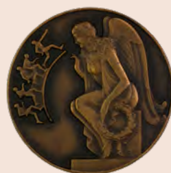
La récompense ira au vainqueur, 1924-1925

Victoria est l'équivalent romain de la déesse grecque Nikê (Νίκη), qui personnifie la victoire (tant militaire, que sportive et artistique) et le triomphe. Cette déesse est devenue au fil des siècles une allégorie, reprise par les artistes à partir du XVI e siècle. Reconnaisable à la palme de la victoire qu'elle tient dans une main et à la couronne du triomphe qu'elle tient dans l'autre, la Victoire est toujours drapée et ailée. L'Olympisme moderne se saisira de cette figure et de ses attributs sur les médailles comme sur les diplômes.