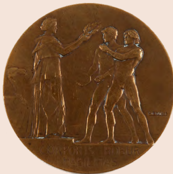
Médaille des Jeux interalliés de Paris 1919

L'interruption due à la Première Guerre mondiale (1914-1918) donnera sur l'organisation de « Jeux du renouveau » en 1919 : les Jeux interalliés qui sauront perpétuer l'idée de l'Olympisme au-delà de la tragédie.