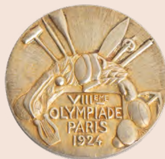
Médaille des Jeux Olympiques de Paris 1924, André Rivaud (graveur), argent doré, collection privée

C'est à la Monnaie de Paris qu'il revient une nouvelle fois de frapper les contingents de médailles de participants (9 500 exemplaires) et de vainqueurs (912 pièces). Comme lors des deux éditions précédentes, les États-Unis en raflent l'essentiel, suivis de la Finlande et de la France (38 médailles dont 13 d'or).