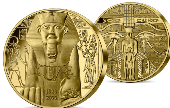
MONNAIE 500€ OR 5 OZ BE* Or 999 % 50 mm – 155.5 g Tirage : 77 exemplaires – 14 950 €