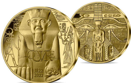
MONNAIE 50€ OR ¼ OZ BE* Or 999 % 22 mm – 7.78 g Tirage : 500 exemplaires – 750 €