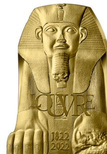
MONNAIE 200€ OR 1 OZ BE* Or 999 % 44.2 x 29.6 mm – 22.2 g Tirage : 250 exemplaires – 3 000 €