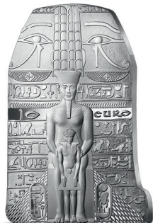
MONNAIE 10€ AG BE* Argent 999 % 44.2 x 29.6 mm – 22.2 g Tirage : 5 000 exemplaires – 89 €