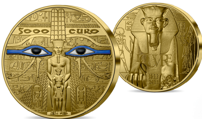
MONNAIE 5 000€ OR 1KG BE* Or 999 % 100 mm – 1 000 g Tirage : 14 exemplaires – Prix sur demande