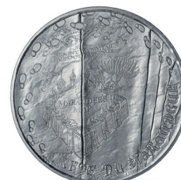
CARTE DU MARAUDEUR