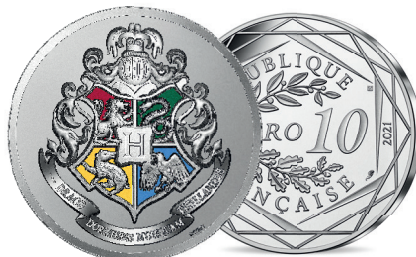
LES MONNAIES EURO OR ET ARGENT