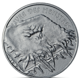
LIVRE DES MONSTRES