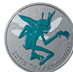
LUTIN DE COURNOUAILLES