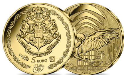
LES MONNAIES DE COLLECTION

Cette collection Harry Potter se présente en trois typologies de produits :